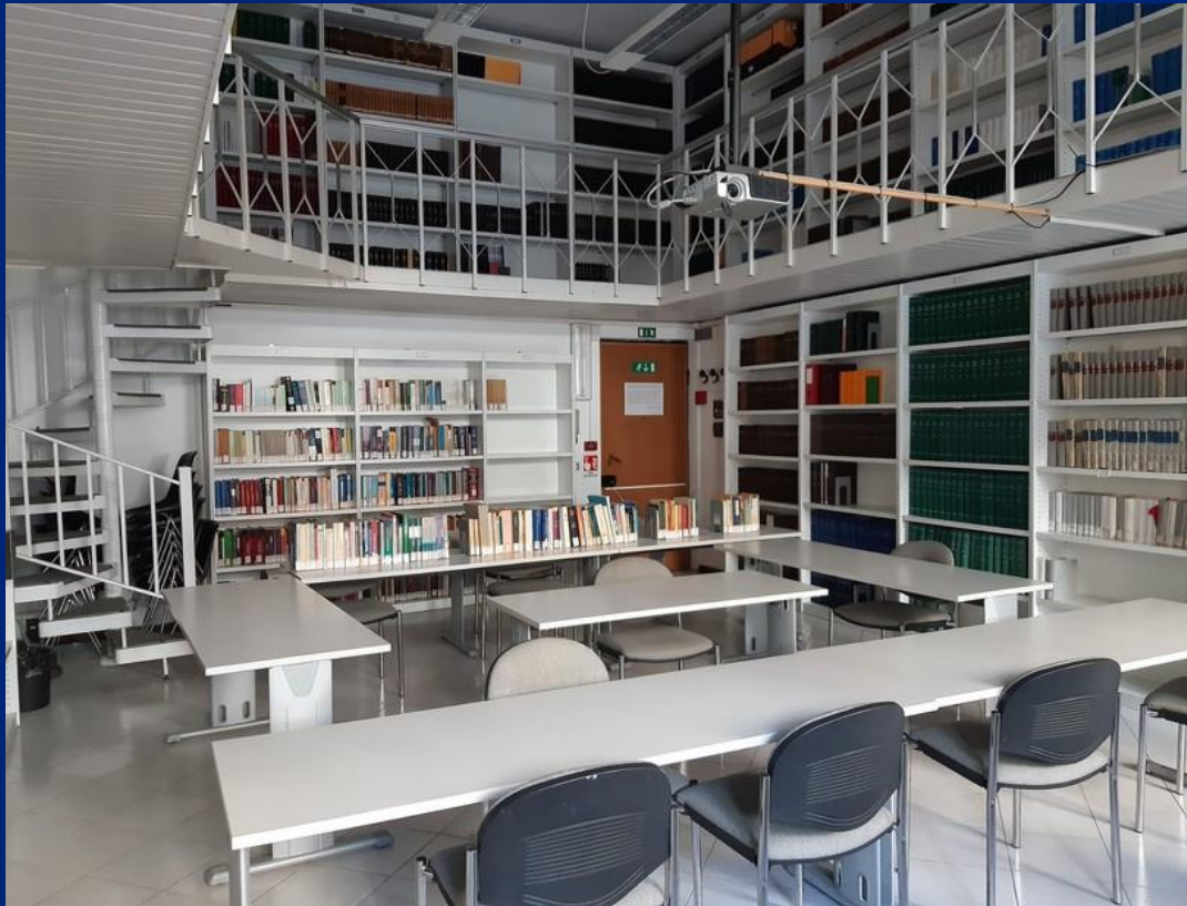
Biblioteca di Scuola di Scienze Sociali - Sede di Giurisprudenza "P.E.Bensa". Università di Genova Via Balbi 130r | 16126 Genova Tel: 010 2099883 email: bibliogiurisprudenza@unige.it